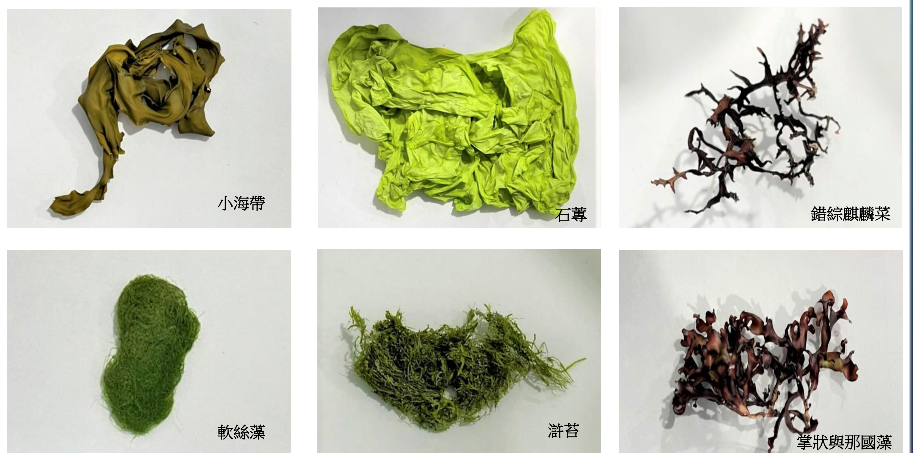
表一、優勢藻種含碳量(mg/g)，卯澳、潮境兩處保育區的潮間帶或潮下帶，優勢藻種的生物量亦隨著季節而有變動。王功保育區大部分的範圍均屬沙岸地形，無法提供海藻附着，因此藻種數量較少。

顆粒性有機碳(Particulate organic carbon, POC)在卯澳灣於C站POC濃度於冬季和春季時呈現明顯的垂直分布，而在夏季及秋季未觀察到此情形。潮境保育區在春季時近岸與離岸的濃度值則有上升的趨勢，且於近岸的A站表層出現最高值；然而於夏季採樣期間下降，隨後又於秋季略微上升。在王功保育區中沿河道往外三個採樣點隨著季節變化，在夏季及秋季則出現上升的趨勢。溶解性有機碳(Dissolved organic carbon, DOC)在卯澳灣中最離岸的C站溶解性有機碳濃度則呈現明顯的垂直分布，並且在夏季B站10 m處發現最高值。潮境保育區中A站的DOC濃度變化相同於POC的趨勢，春季期間出現高值，於夏季則有略微下降，隨後秋季期間明顯上升。然而，在離岸B站DOC濃度則呈現明顯的垂直分布。王功保育區屬於泥沙質淺灘並無垂直深度之採樣，於B站在夏季採樣期間發現最高值，而秋季之分析結果相較於夏季採樣期間略下降。