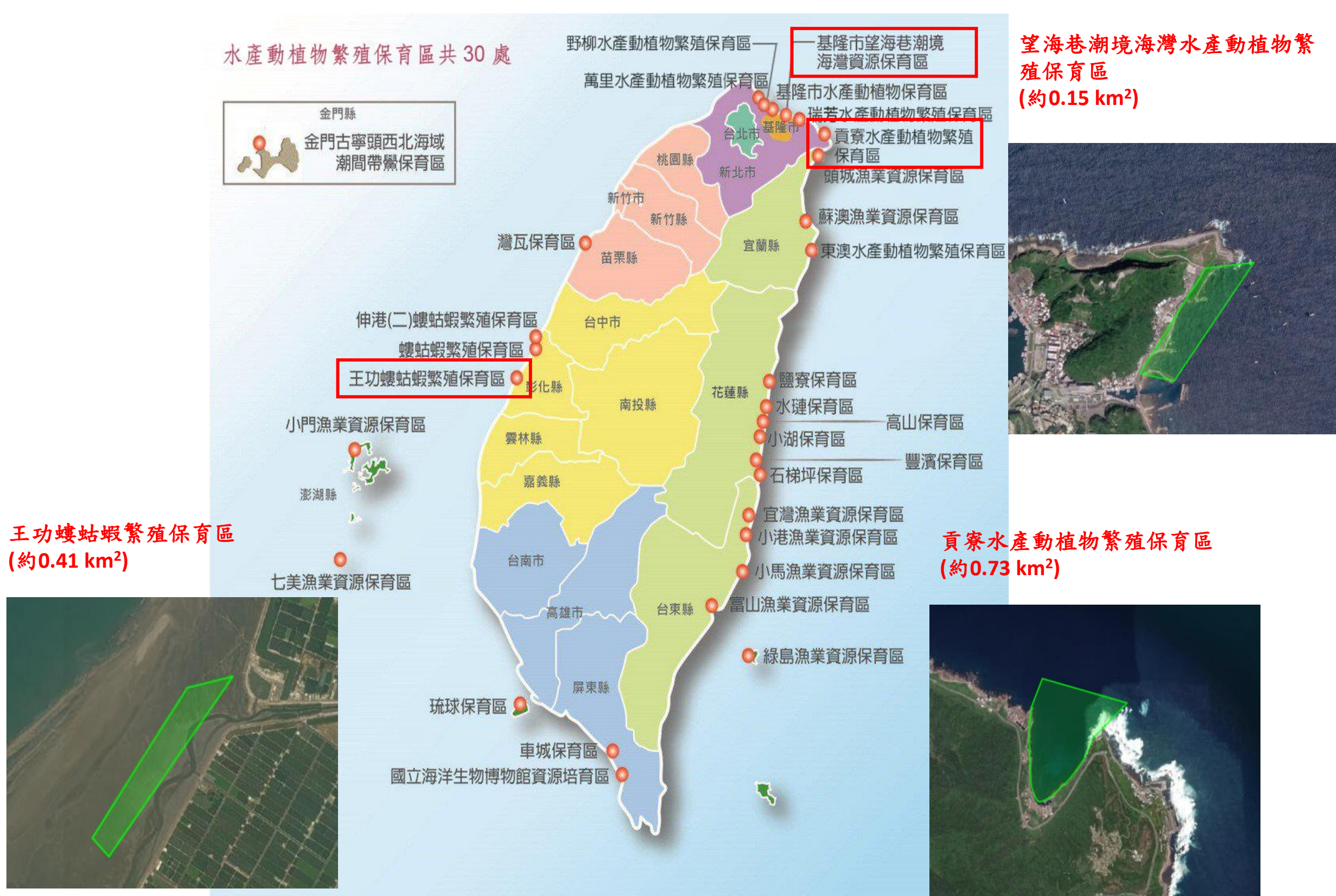
圖一、本研究於臺灣北部與中部地區之水產動植物繁殖保育區進行有機碳含量分析